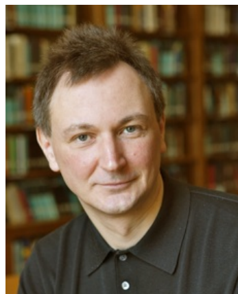
Voevodsky, School of Mathematics, Institute for Advanced Study, Princeton, Nueva Jersey.

muestra propensión a no aceptar el marco dado y tiene problemas con la sociedad comunista de la Rusia de aquellos tiempos: es expulsado en tres ocasiones del instituto, una de ellas por cuestionar la afirmación de su profesora de que Dostoievski era un autor pro-comunista.