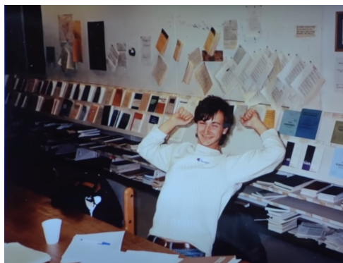
Voevodsky, en una de sus frecuentes sesiones de estudio en bibliotecas nocturnas.

Cuando Voevodsky es expulsado en 1989 de la Universidad de Moscú, la Unión Soviética está inmersa en la perestroika y es posible el intercambio de estudiantes. Beilinson, que acaba de incorporarse a la Universidad de Chicago y es ya una figura internacional, y Kapranov, que también estaba trabajando entonces en los EE. UU.,