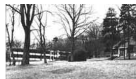
El I.H.E.S. en los 60

Tras un breve período ligado al C.N.R.S. ( Centre National de la Recherche Scientifique ), pasa, en 1973, a Montpellier donde se incorpora como profesor de la universidad. Aunque continúa reflexionando sobre Matemática, abandona la tarea de publicar. En esta época influirá en el quehacer matemático a través de su correspondencia. En 1984 vuelve al C.N.R.S., retirándose definitivamente en 1988, a los 60 años. Sintiendo maltratado por la dirección del C.N.R.S. elabora unas memorias (tituladas Recoltes et Semailles ) en las que arremete