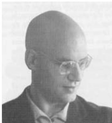
Grothendieck en los 70

grar formalmente. En todo caso, quedaba abierta la cuestión de la comparación entre la teoría discreta y la continua. La intuición de Grothendieck era que la conexión debía venir dada por los complejos de operadores diferenciales. Él mismo obtuvo un primer resultado fundamental: el teorema de comparación [12] que enuncia que la cohomología singular con coeficientes en \mathbb{C} se puede recuperar algebraicamente mediante la hipercohomología del complejo de De Rham algebraico. Este es un resultado que liga los coeficientes continuos, ya que los haces de formas diferenciales son coherentes, y los discretos, ya que estamos calculando la cohomología singular. Precisamente la cohomología cristalina surge como un intento de trasponer estas construcciones al caso de característica positiva. Relacionados con estas ideas se encuentran los trabajos de Mebkhout de dualidad para \mathcal{D} -módulos sobre variedades analíticas complejas. Por estos trabajos, Grothendieck ha considerado a Mebkhout un discípulo “póstumo”, por haber completado su programa de comparación de ambos tipos de coeficientes cohomológicos. Una extensión adecuada de la teoría de los \mathcal{D} -módulos a característica positiva serviría para extender las seis operaciones de Grothendieck al contexto cristalino. Varios grupos de matemáticos trabajan actualmente en esa línea.