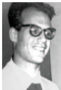
Grothendieck cerca de 1966

Veamos alguna de las aportaciones de esta tesis. Dados dos espacios vectoriales topológicos, E y F , se trata de definir una construcción análoga al producto tensor de los dos espacios que tenga en cuenta las topologías. Si E y F son de dimensión finita no hay ninguna dificultad, puesto que existe una única topología razonable en E \otimes F , que también posee dimensión finita. En el caso de dimensión infinita, Grothendieck propone dos soluciones “razonables” al problema. Una de ellas consiste en completar E \otimes F para la topología más fina que hace la aplicación E \times F \rightarrow E \otimes F continua y que denotaremos T_p . La topología T_p se caracteriza también como aquella que posee un sistema fundamental de entornos del 0 formado por las envolturas convexas equilibradas 3 de los productos U \otimes V con U y V entornos fundamentales de 0 en E y F , respectivamente. La completación de este espacio se denota E \hat{\otimes} F . Esta construcción conserva muchas propiedades