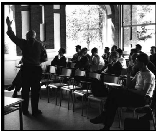
Grothendieck durante una sesión de su seminario de Geometría Algebraica

aplicación de esta cohomología es el cómputo de los números de Betti. Para un primo \ell diferente de la característica del cuerpo base de la variedad, empleando la topología étale 9 , se definen módulos H_{\text{ét}}^i(V, \mathbb{Z}_\ell) sobre el anillo de enteros \ell -ádicos \mathbb{Z}_\ell , y, tensorizando por su cuerpo de fracciones \mathbb{Q}_\ell , espacios vectoriales H_{\text{ét}}^i(V, \mathbb{Q}_\ell) cuya dimensión es el i -ésimo número de Betti \ell -ádico de la variedad V . Con esta construcción se tienen los ingredientes necesarios para probar tres de las cuatro conjeturas de Weil sobre el número de puntos